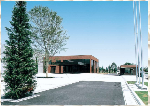
群馬森紙業(株)尾島事業所