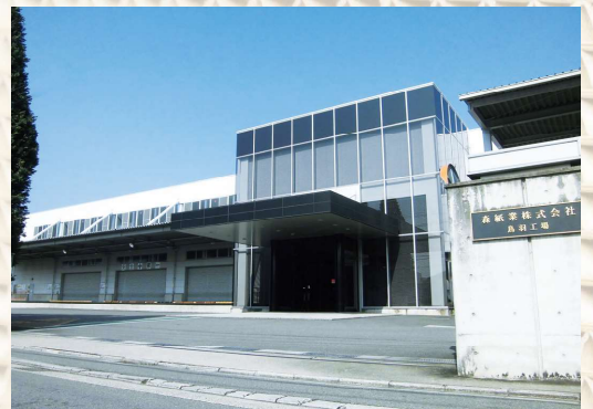
森紙業(株)包装紙事業部