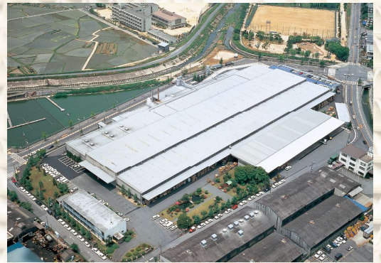
森紙業(株)関西事業所

北海道から九州まで、全国に展開する森紙業グループには、分社経営と現地主義という2つの大きな特徴があります。分社化することによって幅広い権限を各工場・支店に委譲し、ほとんどの業務を現地で責任を持って即決即断する——そんなフレキシブルな経営形態をとることで、すばやいレスポンスときめ細かな顧客サービスを実現しています。さらに森紙業グループ最大の特徴といえるのが、ネットワークの強みです。各拠点はひとつひとつ独立しながらもグループ全体の代表窓口として機能しているのです。万が一自然災害などのトラブルが発生した場合でもグループネットワークをフル活用し、全国レベルでスケールメリットを発揮。段ボールであれ、紙器であれ、包装紙であれ、あるいは原紙販売であれ、紙に関わるトータルなサービスの提供が可能です。