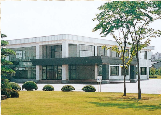
長野森紙業(株)塩尻事業所