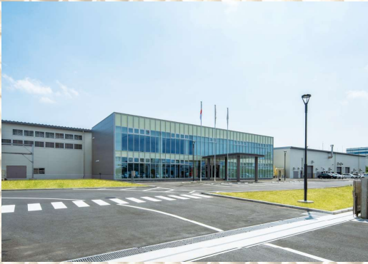
森紙業(株)千葉事業所