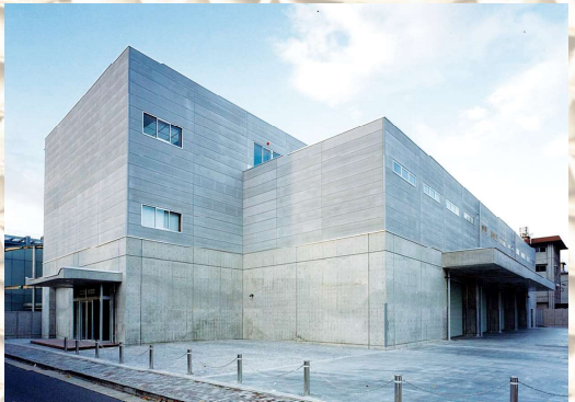
森紙販売(株)京都支店