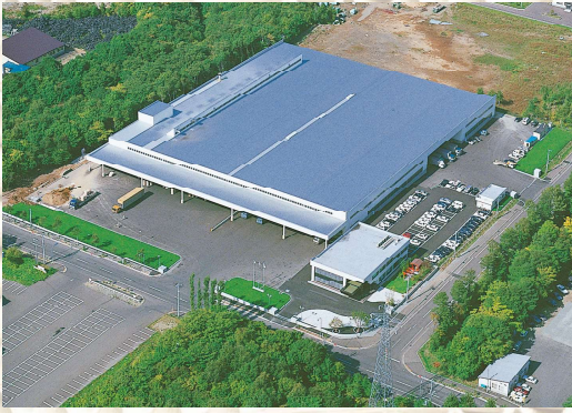
北海道森紙業(株)札幌事業所